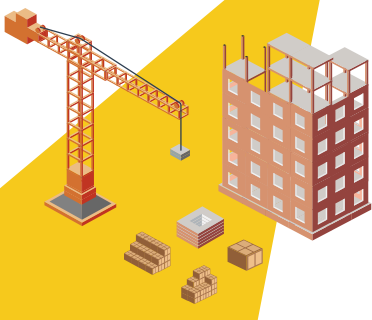
OBRAS E INSTALACIONES