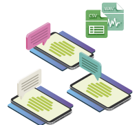
MESSAGING & CHAT

Wir sind zusammen auf diesem Schiff, wir werden diese Situation gemeinsam steuern. Wenn Sie etwas von uns benötigen oder zusätzliche Möglichkeiten sehen, wie wir Sie unterstützen können, teilen Sie uns dies gerne mit.