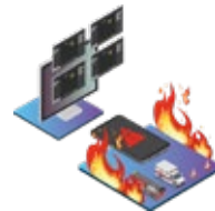
BOTÓN DE ALARMA Y EMERGENCIA