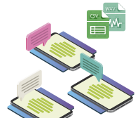
MENSAJERÍA Y CHAT

Estamos juntos en este barco, navegaremos juntos por esta situación. Si necesita algo de nosotros o formas adicionales en las que podemos apoyarlo, infórmenos.